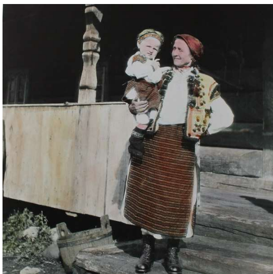
Рис. 5. Гуцулка з дочкою на руках, деталі крою. Село Ясіня Рахівського району. 1921 р.