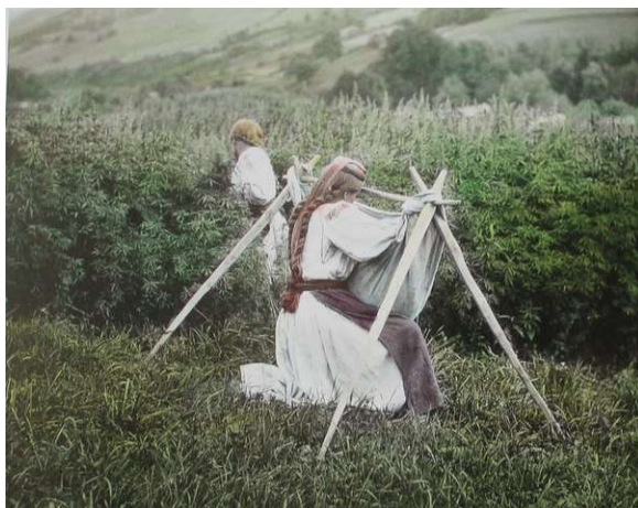
Рис. 2. Мама заспокоює дитину в польовій колисці. Село Сухий Великоберезнянського району. 1921 р.