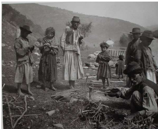
Рис. 3. Циганська община. Початок 20-х рр. XX ст.