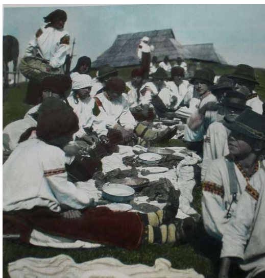
Рис. 4. Обідня перерва на толоці під час сінокосів. Село Ясіня Рахівського району. 1921 р.