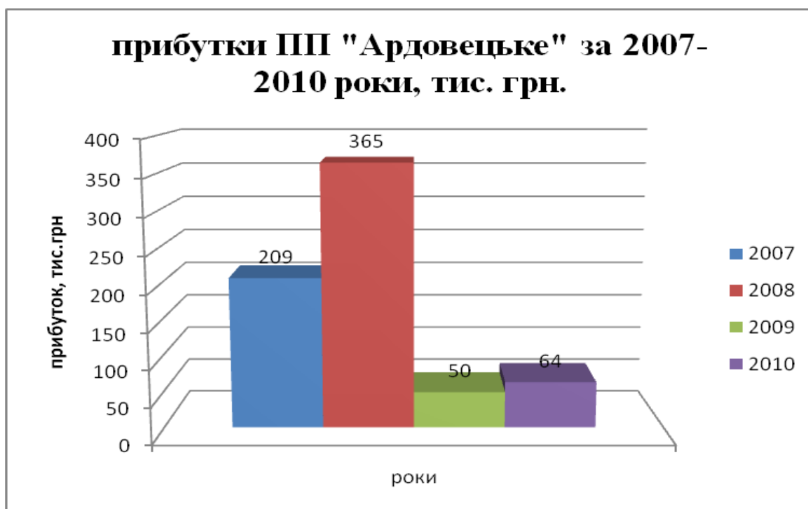
Рис.2.2. Прибутки ПП «Ардовецьке» за 2007-2010 рр. [18, 19, 20]