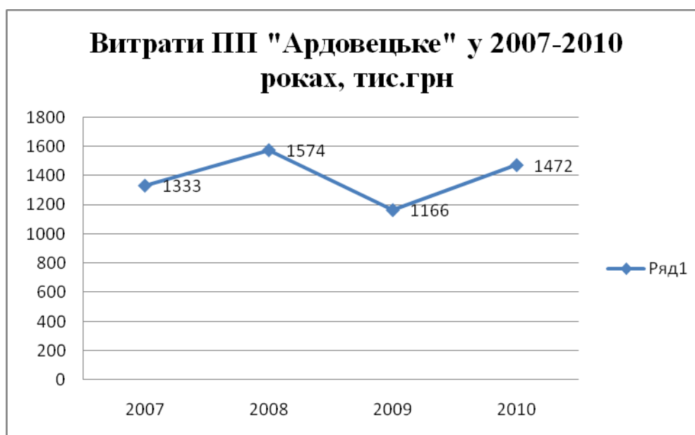
Рис.2.2. Фінансові результати ПП «Ардовецьке» за 2007-2010 роки [18, 19, 20]