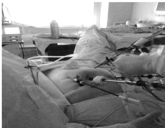
Рис. 1. Расположение троакаров при операции на прямой кишке.

стент – слева, второй ассистент – с видеокamерой у головного конца операционного стола. Монитор устанавливался в ногах пациента. Операции выполнялись под эндотрахеальным наркозом, возможна комбинация со спинальной анестезией. Для выполнения операции использовали 4-5 троакаров (рисунок 1).