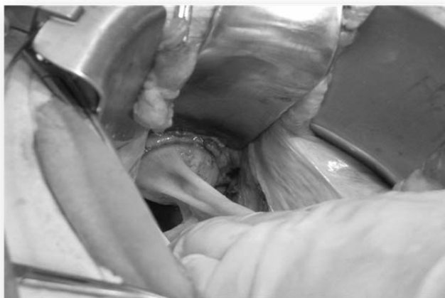
Рис. 4. Формирование анастомоза циркулярным швико-сшивающим аппаратом.

кишку вставляется головка циркулярного швико-сшивающего аппарата, после чего кишка опускается в брюшную полость, где формируется циркулярный анастомоз по типу «конец в бок» (рисунки 4).