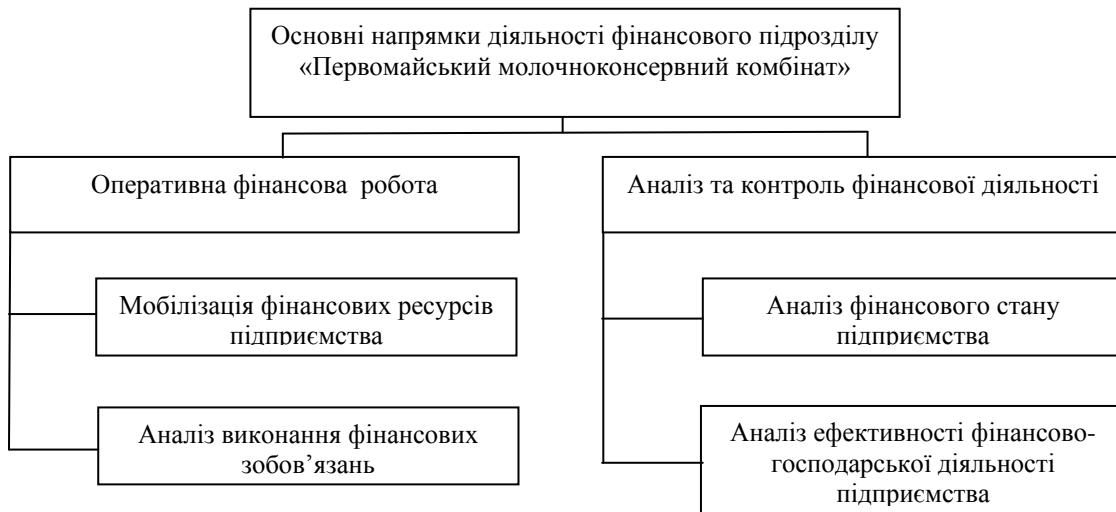
Рис. 2. Напрямки діяльності фінансового підрозділу *