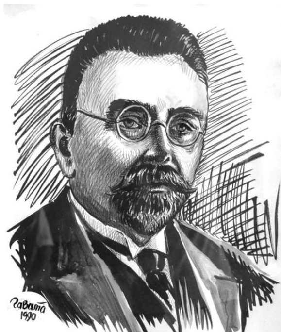
Рис. 2. Микола Дмитрович Стражеско – лікар-терапевт, один із засновників київської терапевтичної школи, у тому числі і вітчизняної кардіології, академік АН УРСР, СРСР, АМН СРСР, Герой Соціалістичної Праці.

Дав класичний опис клініки інфаркту міокарда (1910, спільно з М.Д. Стражеском).