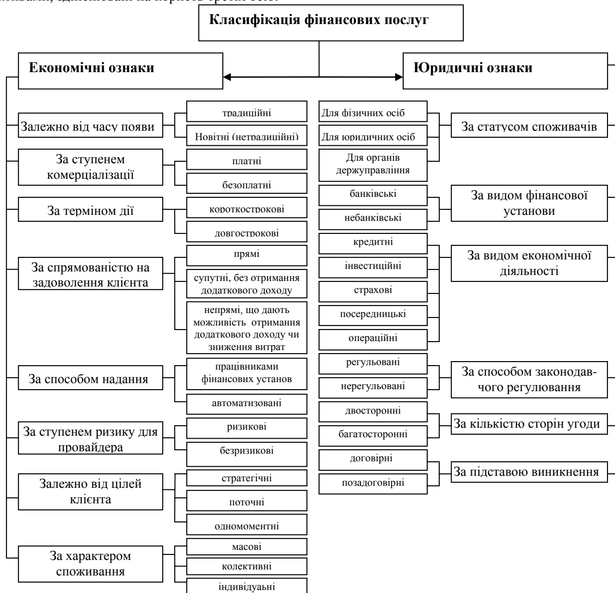
Рис. 1. Класифікаційні ознаки та види фінансових послуг*

особами, а також операції з фінансовими активами, здійснювані на користь третіх осіб.