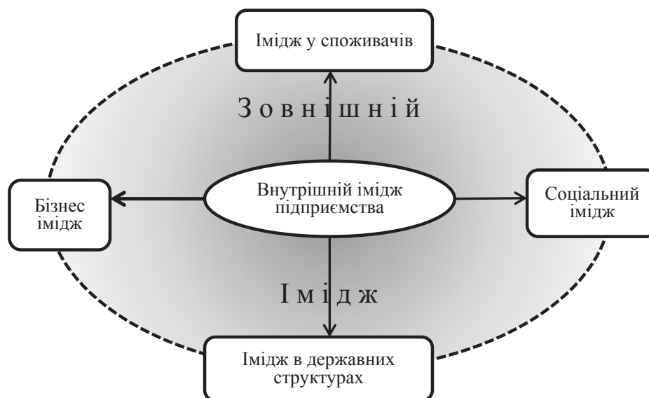
Рис. 2. Структура іміджу підприємства

Також можна стверджувати, що позиціонування на основі сприйняття ознак товару є важливим для споживчих товарів групи повсякденного попиту. У разі спожив-