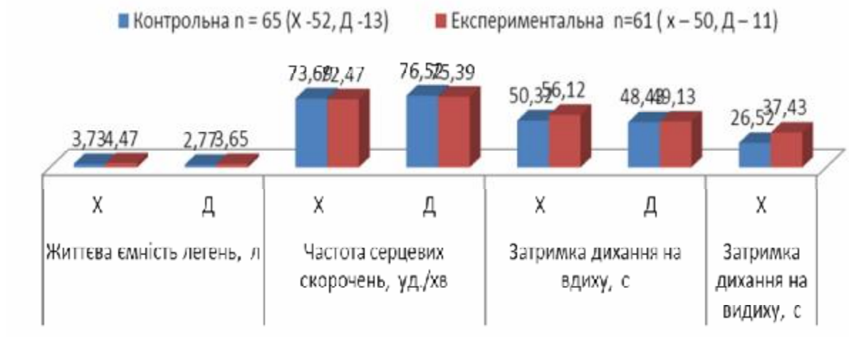
Рис. 2 Рівень функціонального стану студентів контрольної та експериментальної груп після педагогічного експерименту

Наочно результати дослідження подані на рис 2.