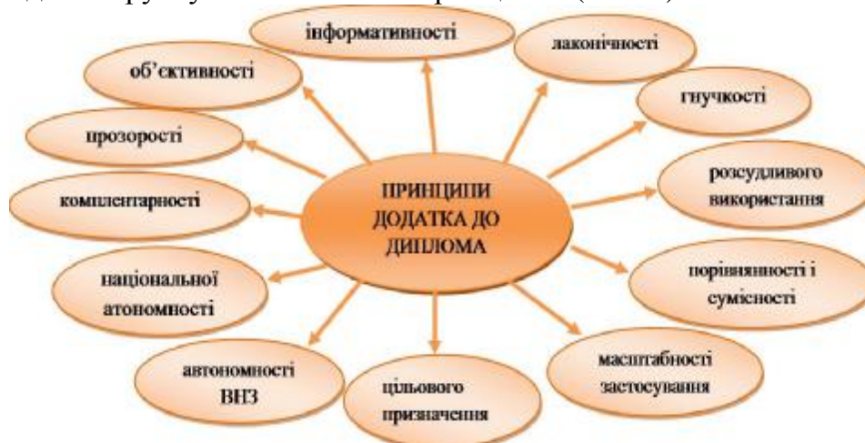
Рис. 1. Принципи додатка до диплома

ДД базується на важливих принципах, які поважають національну і університетську академічну автономію та розкривають цілі закладені в основі ДД. Основні положення, що визначають зміст ДД, формат і вимоги до укладання ґрунтуються на таких принципах (Рис. 1):