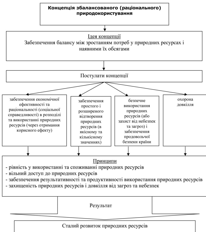
Рис. 2. Концепція збалансованого (раціонального) природокористування

Отже, розглянувши теорії природокористування і генезу їх становлення, можна зробити висновок про вагомий внесок економістів різних країн та течій у процес управління відновлювальними природними ресурсами. Досліджені вище концепції природокористування дозволяють визначити базові засади переходу на модель збалансованого природокористування, розробити виважений механізм управління відновлювальними природними ресурсами.