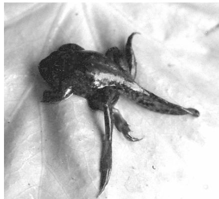
Рис. 2. Головастик озерной лягушки R. ridibunda из урочища Кинь Грусть с пятью конечностями.

Токсикологические анализы воды были сделаны в Институте гидробиологии НАН Украины (Киев) по стандартным методикам (Методи гідроекологічних досліджень..., 2006).