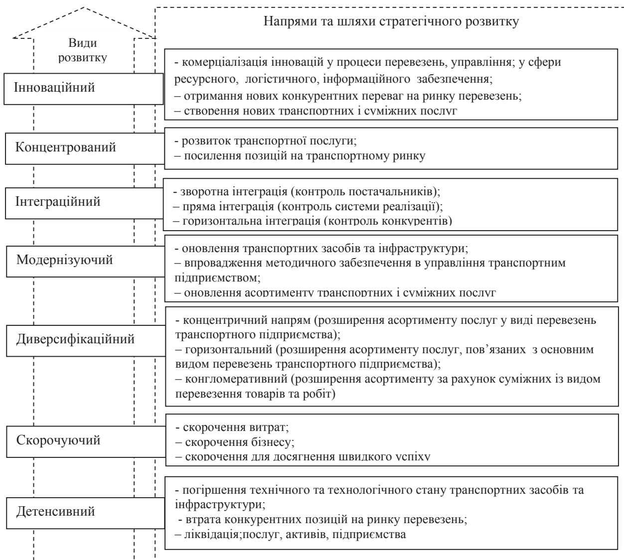
Рис. 2. Стратегічні напрями розвитку потенціалу конкурентоспроможності транспортного підприємства (розроблено автором)

3. За функціональними напрямками певної сфери діяльності (сфери діяльності транспортного підприємства, крім надання транспортних послуг, можуть бути пов'язані з постачанням, складуванням, експедиторською, інвестиційною, виробництвом тощо) визначають функціональні стратегії.