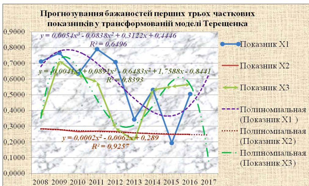
Рис. 1. Лінії тренду, їх тип, аналітична залежність та коефіцієнти детермінації часткових значень показників x_1-x_3 трансформованої моделі Терещенка

Вищі ступені полінома виносять прогнозоване значення показника x_1 на 2017 рік за межі області [0; 1] ,