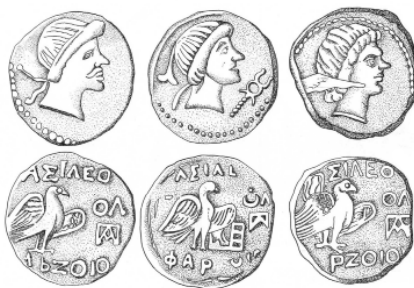
Рис.1. Ольвия: 1. План городища. Штриховкой отмечена застройка города первых вв. н.э. 2. Фрагмент краснолакового кувшина с граффити (рисунок Т.А.Зиновьевой). 3. Золотые монеты царя Фарзоя (рисунок М.В.Русяевой).