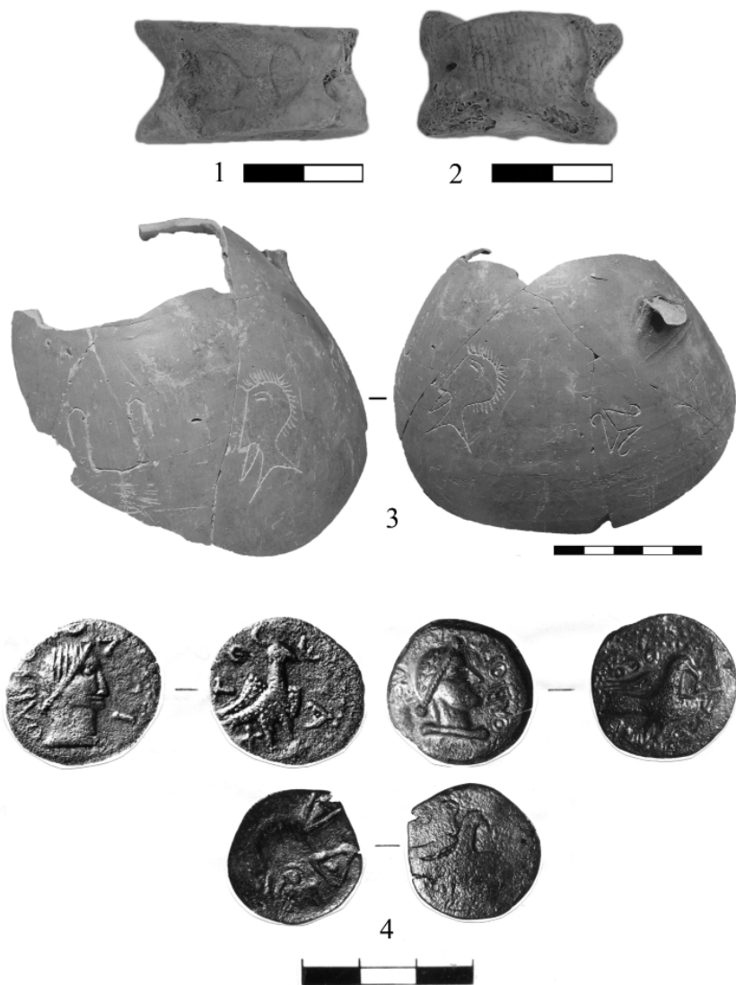
Рис.2. Ольвия: 1. Астрал с тамгой Фарзоя. 2. Астрал с насечками. 3. Фрагмент краснолакового кувшина с граффити. 4. Городские медные монеты I в. н.э.