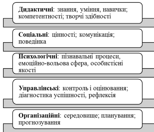
Рис. 1. Види ситуацій взаємодії за спрямованістю педагогічного впливу

Дидактична взаємодія може бути представлена матрицею зв’язків (ситуацій), які об’єднуються у групи за ознакою спрямованості (див.рис 1).