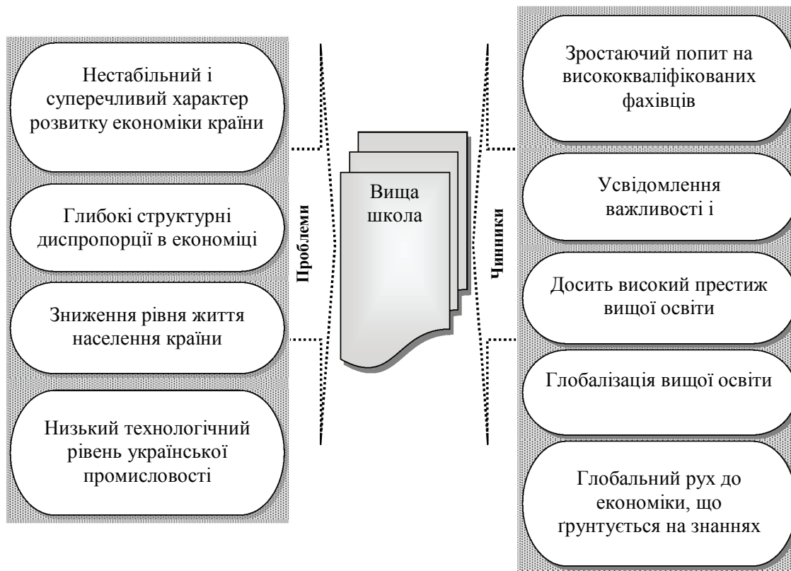
Рис. 1. Проблеми та чинники, що визначають можливість трансформації вищої школи

Зважаючи на чинники, які сприяють трансформації системи вищої освіти, необхідно враховувати той факт, що в даний час цей процес пов'язаний із цілим рядом проблем (рис. 1).