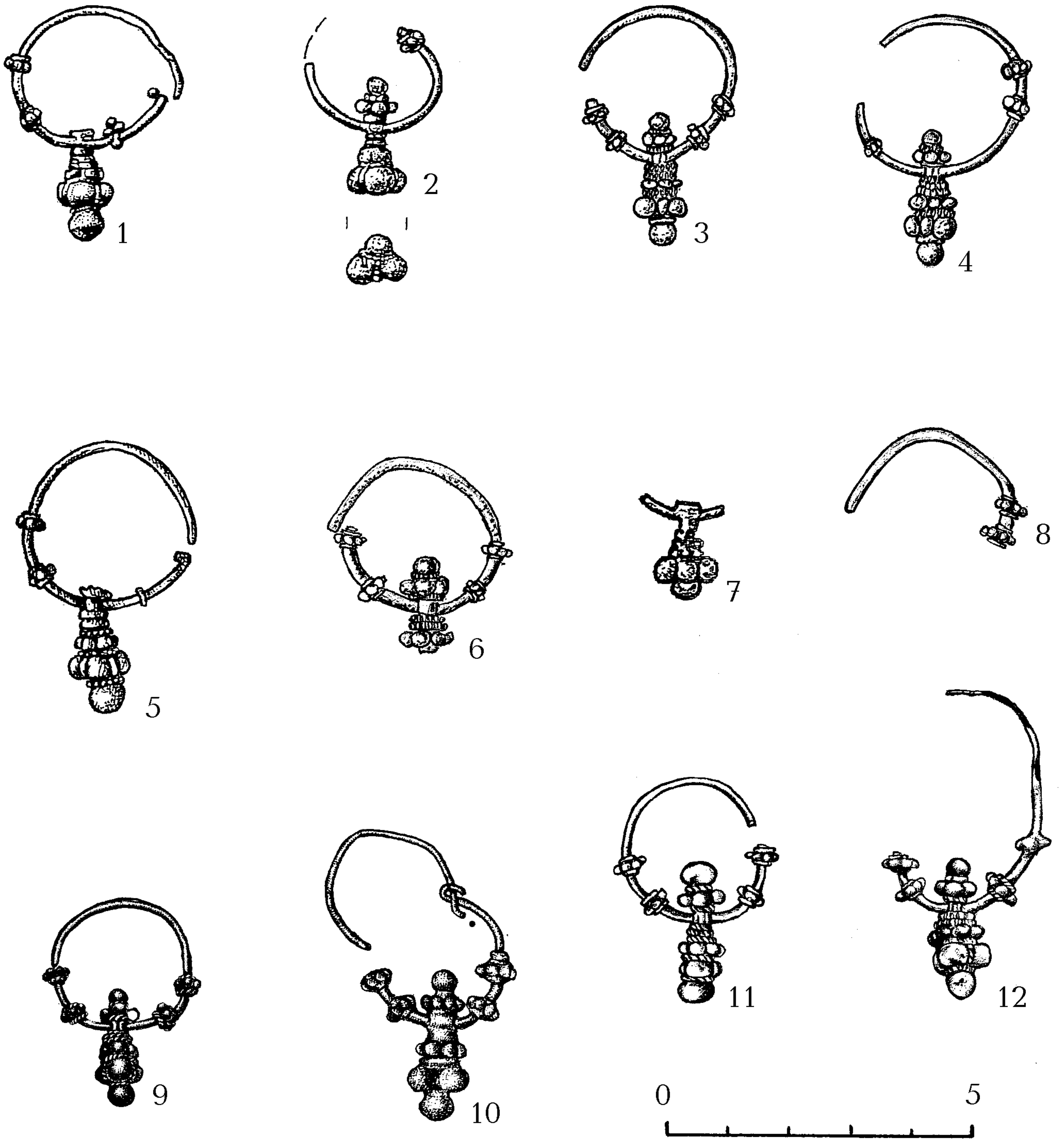
Рис.1. Сережки екімауцького типу з поховань в басейні р.Тиси. 1 – 8 – Чома; 9 – Дьогє; 10 – Тисабєрцєл; 11 – 12 – Ібрань (по Е.Іштвановіч).