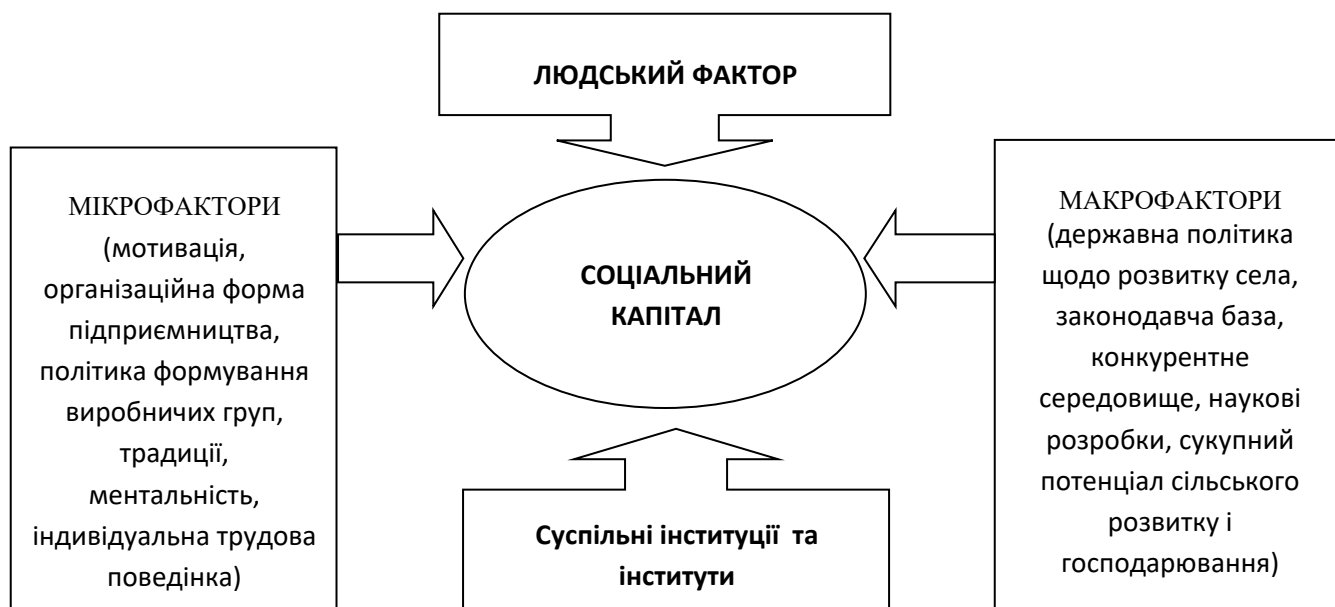
Рис. 1. Фактори формування соціального капіталу на селі

З одного боку, засади проявляються у традиціях створення і функціонування підприємницьких структур (вибір організаційної форми і організація господарювання), а з іншого – у державній політиці щодо села. Засади і принципи формування соціального капіталу залежать від традицій господарювання (виробничо-господарських утворень) та державної політики щодо розвитку села. Традиції організаційних утворень вважаємо мікрофакторами, а політику розвитку села – макрофакторами щодо формування соціального капіталу (рис. 1).