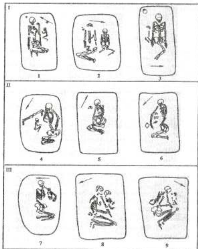
Рис. 1. 1 - Балабинцы, 2/2; 2 - Балабинцы, 1/9; 3 - Жёлтый Яр, 5/4; 4 - Нерушай, 9/9; 5 - Пляши, 15/2; 6 - Яски, 6/14; 7 - Траповка, 1/6; 8 - Холмское, 2/4; 9 - Холмское, 2/13.