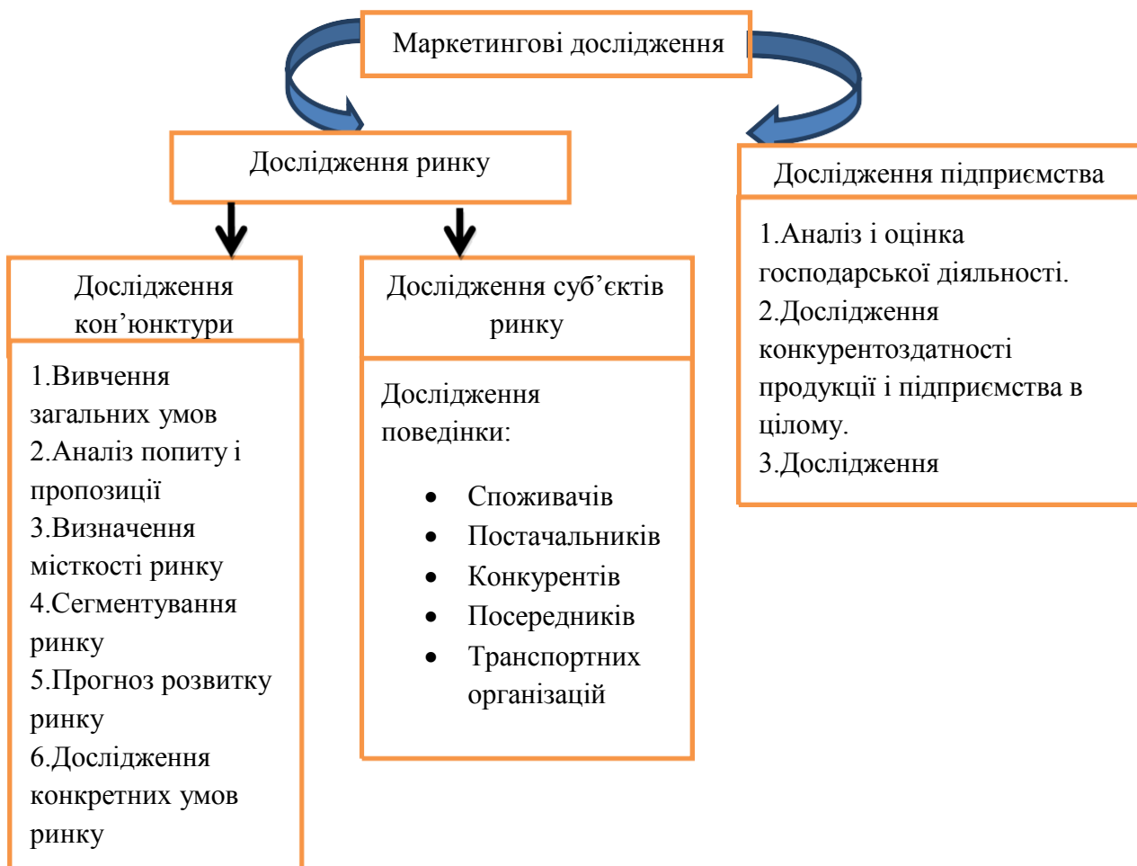
Рис.1. Структура маркетингових досліджень [3, с. 66]

Маркетингове дослідження зазвичай починається із збирання вторинної інформації, яке ще називається «кабінетним дослідженням». Складові елементи маркетингових досліджень подані на рис. 1