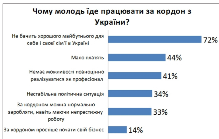
Рис. 3. Основні причини міграції серед молоді (дані опитування серед молоді, проведеного міжнародним кадровим порталом “HeadHunter” у січні 2017 року) [5]

На прикладі багатьох країн світу можна зробити висновок, що повернення на Батьківщину і зменшення міграції відбувається не тоді, коли є робочі місця та гідна зарплата, а набагато раніше. Люди додому повертатимуться тоді, коли бачитимуть у своїй країні перспективи розвитку. Коли є усвідомлення того, що саме вдома молоді люди мають якісь можливості. Наприклад, у Китаї раніше спостерігалася величезна міграція за кордон. Навіть зараз рівень життя у цій країні є значно нижчим, ніж, наприклад, в США. Але саме в Китаї спостерігається повернення з еміграції насамперед кваліфікованих працівників, бізнесменів, які бачать у цій країні можливість для реалізації. Там менша конкуренція, кращі умови для ведення бізнесу. Зрештою, патріо-