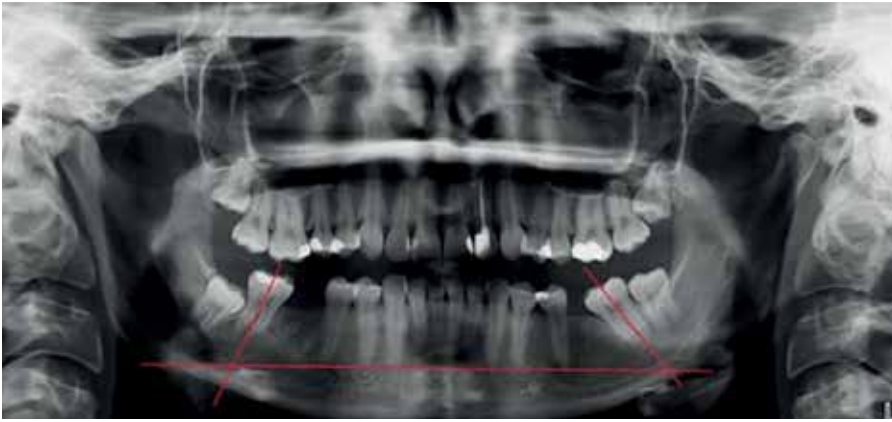
Мал. 1. Методика вимірювання ангуляції других молярів нижньої щелепи на ОПГ пацієнта І групи дослідження до ортодонтичного лікування

надмірної ангуляції, що може компроментувати результати ортодонтичного лікування, спричиняти перевантаження тканин пародонта та виникнення рецидивів [1, 6, 11]. Використання ортодонтичних міні-імплантатів як анкоражної опори при потребі значних переміщень зубів обґрунтоване малоінвазивним характером хірургічного втручання, можливістю застосування методики в умовах складних клінічних випадків, доказовою ретроспективною ефективністю їх використання та можливістю скорочення терміну комплексної реабілітації пацієнтів [2, 4, 9]. Зокрема, Р.Г. Оснач та О.А. Беда [3] проводили мезіалізацію зубів, що дистально обмежують дефект зубного ряду, за допомогою ортодонтичного апарата власної конструкції у пацієнтів віком від 18 до 40 років. У результаті лікування пацієнтів усіх груп було відмічено, що переміщення молярів у ділянку дефекту залежить від періоду між видаленням зуба і початком використання ортодонтичного апарата. Більш швидке переміщення спостерігали у випадку, коли проміжок часу між видаленням і фіксацією апарата не перевищував 2-4 тижні. Також було продемонстровано швидше переміщення молярів у молодшій віковій групі від 18 до 24 років, порівняно з середньою (25-30 років) і старшою (31-40 років) групами. Проте автори не досліджували зміни кісткової тканини навколо зубів, що підлягали мезіаліза-