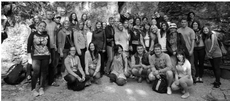
Студенти УжНУ під час Літньої школи у Пряшеві (Словаччина)

освіти викладачі факультету суспільних наук та студенти філологічного факультету пройшли наукове стажування на різних факультетах Пряшівського університету, в Університеті імені Я.А. Коменського (Братислава), Трнавському університеті, Гімназії ім. Павла Горова у Михайлівцях. Щорічно у цій програмі беруть участь близько 45 студентів.