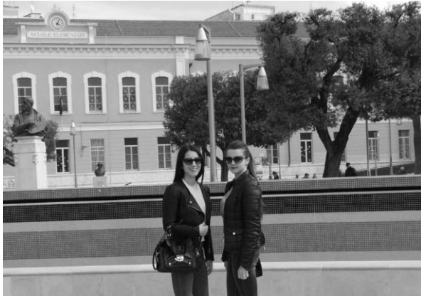
Студенти УЖНУ в Університеті м. Фоджіа (Італія)

Продовжується активна співпраця між УЖНУ та Поморською Академією у Слупську. Вже систематичним є семестрове навчання наших студентів у польському вищому навчальному закладі за різними напрямками та спеціальностями. У 2015-2016 навчальному році 41 студент мав можливість навчатися у цьому навчальному закладі. У семестровій програмі беруть участь студенти гуманітарних та природничих факультетів.