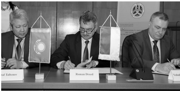
Підписання Меморандуму про створення Міжнародного консорціуму університетів, 23 квітня 2015 р., м.Ужгород

Меморандум про створення Міжнародного консорціуму університетів підписали представники таких вищих навчальних закладів: Ужгородський національний університет, Євразійський національний університет ім. Гумільова в Астані (Казахстан), Вища школа бізнесу – Національний Університет Луїса (Польща), Поморська академія у Слупську (Польща), Західний університет ім. Васіле Голдіша (Румунія), Університет Бабеш-Бояї (Румунія), Університет ім. М. Ромеріса (Литва), Братиславський економічний університет (Словацька Республіка), Мукачівський державний університет, Закарпатський угорський інститут імені Ференца Ракоці II, Прикарпатський національний університет імені Василя Стефаника, Український католицький університет, Житомирський державний університет імені Івана Франка, Карпатський університет імені Августина Волошина.