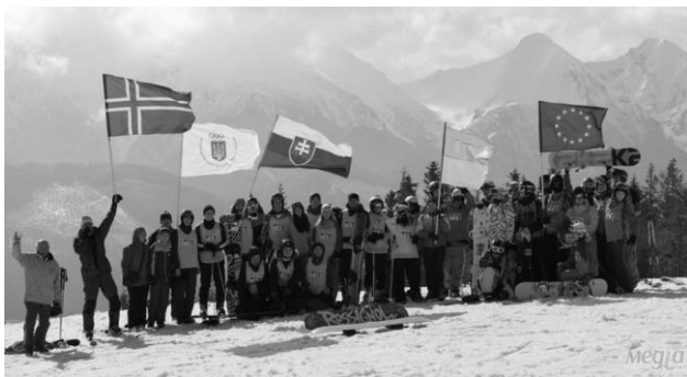
Учасники проекту «Міжнародне молодіжне спортивне партнерство» (Словаччина)