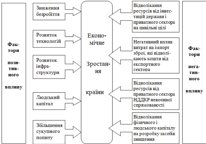
Рис. 2. Фактори впливу воєнних витрат на економічне зростання країни

Таким чином, існують як несприятливі, так і сприятливі фактори впливу воєнних витрат на економічне зростання. На рисунку 2 наведений перелік несприятливих і сприятливих факторів впливу воєнних витрат на економічне зростання.