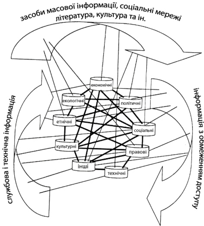
Рис.1. Приклад моделі загальної системи, яка складається з різномірних взаємодіючих систем Інформаційної світоглядної моделі суспільства (ІСМС). За даними роботи [9].

економіки, політології, соціології, екології, права тощо. Наступним кроком є використання методологічних напрацювань т. зв. інформаційної світоглядної моделі суспільства (ІСМС), яка в загальному вигляді описана в роботі [9].