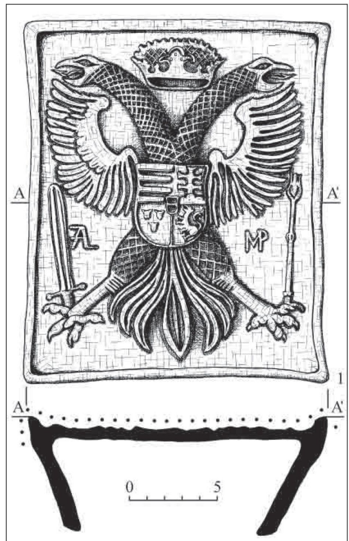
Рис. 1. Королево. Замок Нялаб. Кахля із зображенням герба Габсбургів (реконструкція)

Горизонт I (від сучасної поверхні до 4,5 м) складався, в основному, з масивних уламків стін, завалів великого андезитового каміння, штукатурки та цегли, що суцільним шаром за-