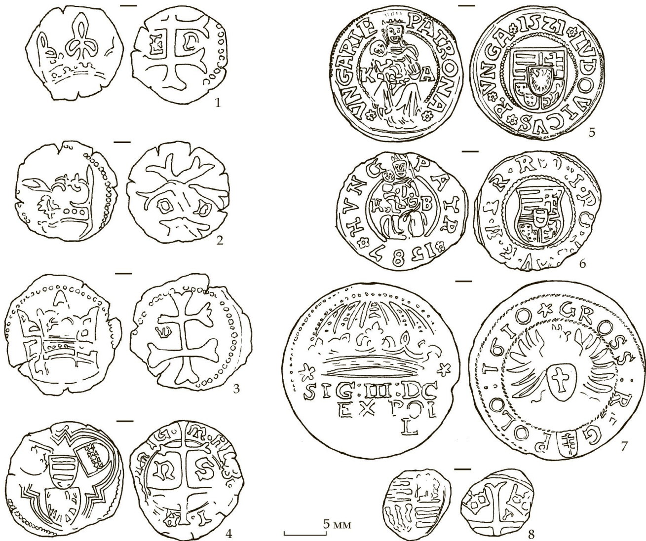
Рис. 2. Мужієво (Зруйнована церква), монети

талі одягу і прикраси (застібки, підковки від чобіт, намистини й колечко), понад двадцять монет (рис. 2), а також фрагменти двох навмисно зламаних шабель.