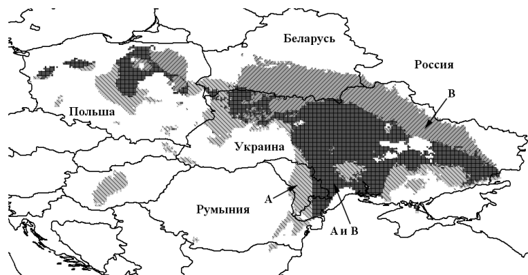
Рис. 2. Моделирование экологической ниши путем экстраполяции распространенности особей с аллелями локуса Es-4 по ареалу прудовика большого L. stagnalis s. lato .

Полученные результаты относительно неоднозначности факторов стабилизации ареалов у разных видовых групп проверены нами путем анализа влияния отдельных факторов на изменчивость частот аллелей диагностического локуса (табл. 1).