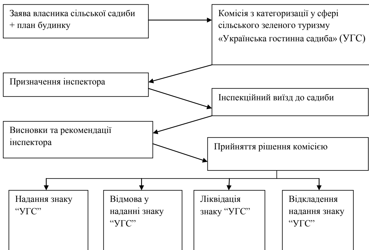
Рис. 2. Алгоритм категоризації сільських садиб Закарпаття*

Примітка: * – сформовано автором на основі [12]