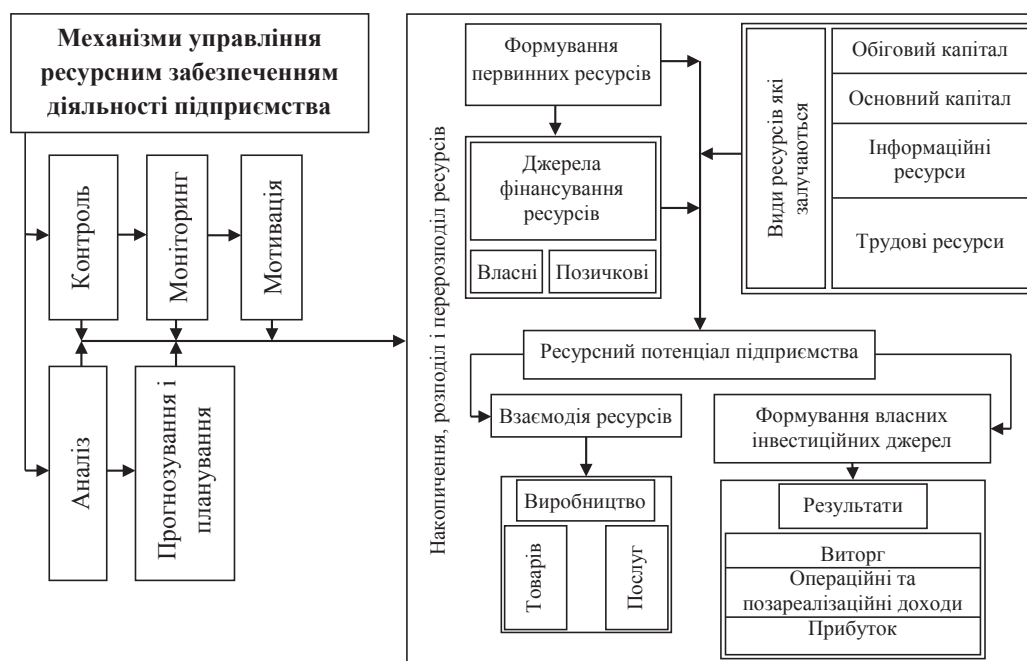
Рис. 3. Структурно-логічна схема механізмів управління ресурсним забезпеченням підприємства в сучасних умовах