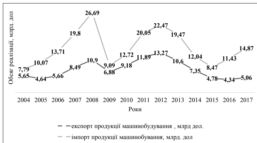
Рис. 1. Експорт та імпорт продукції машинобудування, 2004–2017 рр.