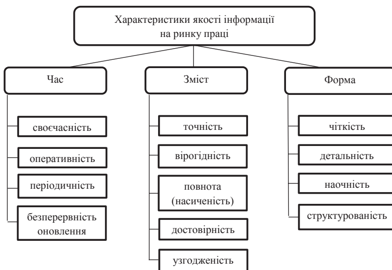
Рис. 4. Характеристики якості інформації на ринку праці

Більшу частину інформації на ринку праці забезпечують його внутрішні організації, які збирають, опрацьову-