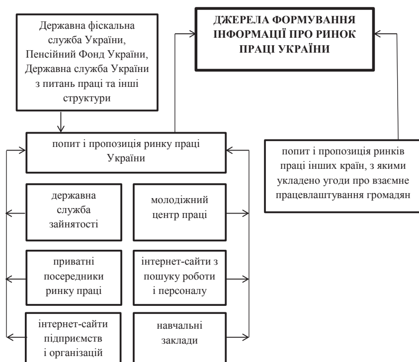
Рис. 3. Джерела формування інформації про ринок праці України

гатися на різних носіях, в тому числі в обчислювальній техніці, та пересилатися і піддаватися обробці. Результатом опрацювання таких даних є формування єдиної бази даних для реалізації функцій планування, організації, координації, керівництва і контролю.