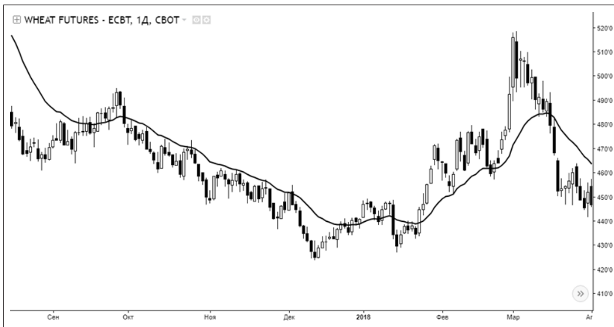
Рис. 3. Приклади використання середньої ковзної для індикації тренду (на прикладі травневого ф'ючерсу на пшеницю, який котирується на ЄВТ)

січня 2018 р. (це притому, що використовувалася коротка 13-денна середня ковзна, яка мала виявити зміну вдвічі раніше). Так само на початку березня 2018 р. ринкова кон'юнктура знову змінилася, а сигнал про таку зміну від середньої надійшов, коли ціна вже знизилася на 8%.