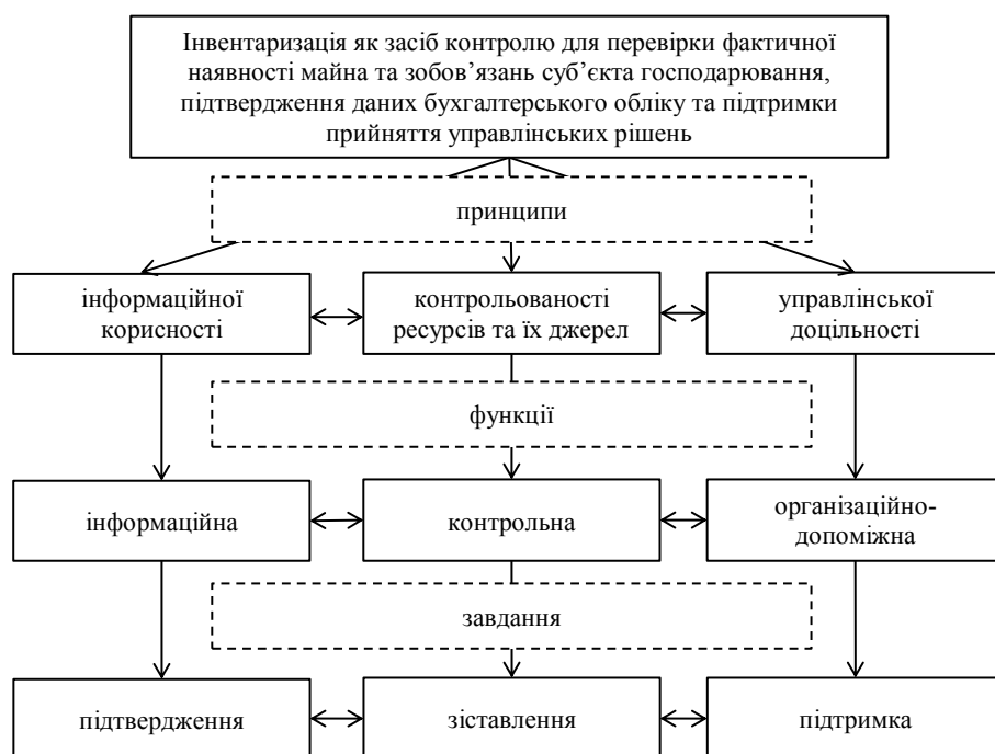
Рис. 2. Теоретичний конструкт поняття «інвентаризація»

*Власне доповнення організаційно-допоміжною функцією