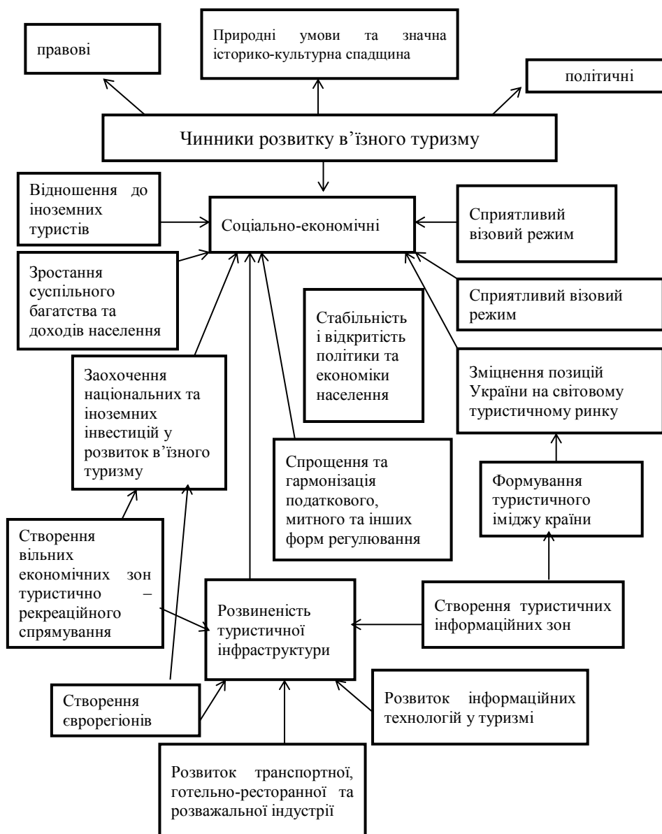
Рис. 2. Чинники розвитку в'їзного туризму [15]

а) прямих інвестицій у формування туристичної індустрії;