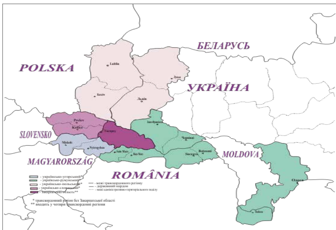
Рис. 1. Транскордонні регіони України за участю Закарпатської області [7]

кий, українсько-польський), у результаті чого вона має в чотири рази більше потенційних можливостей для розвитку, але, відповідно, зростають й загрози. Теж саме стосується й Одеської, Волинської та Чернігівської областей, щоправда, вони входять тільки в два транскордонних регіони: українсько-румунський, українсько-молдовський; українсько-польський, українсько-російський; українсько-білоруський, українсько-російський відповідно. Зокрема, як зазначає Н. Мікула, «транскордонний регіон може охоплювати суміжні території декількох країн, як, наприклад, Волинська область України, Брестська область Білорусії, Люблінське воєводство Польщі чи Закарпатська область України, область Саболч-Сатмар-Берег Угорщини та край Кошіце Словаччини» [2, с. 28].