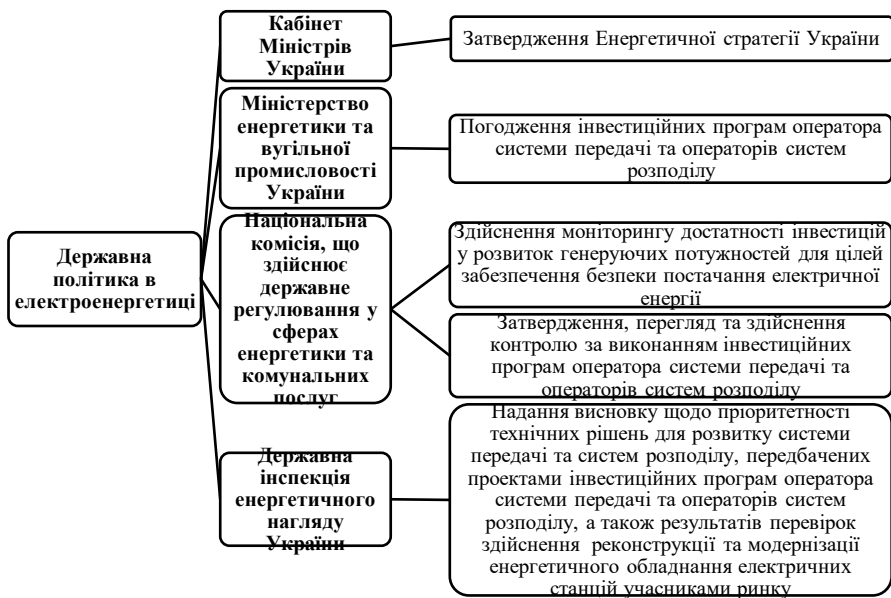
Рис. 1. Суб'єкти реалізації державної політики в електроенергетиці з питань інвестиційних програм та їх повноваження*

*Сформовано автором на підставі джерела: 1