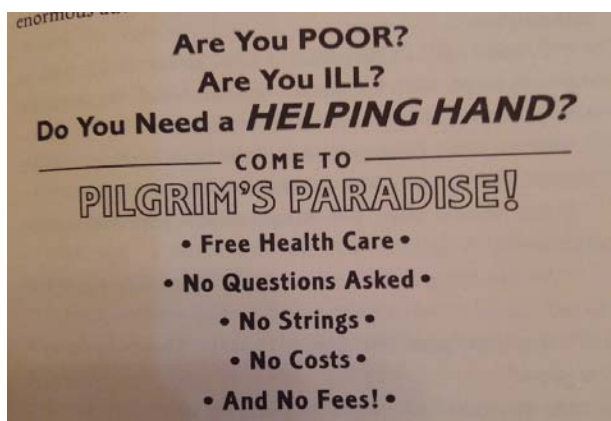
Рис. 2. Креолізований елемент у романі Д. Айвза "Voss"

листа використав для того, щоб проілюструвати іронічність ситуації: оточення елемента наступне: "Leena and Grandma Aleenska lived several streets away, over an abandoned Slobovian beauty salon. A sign still hung in the window [8, p. 22]". Слідом адресант вкраплює оригінальний текст, не змінений особливостями авторського дизайну повідомлення. Спосіб та площа оформлення повідомлення нагадує, що текст оформлений як знак (табличка) на вітрині салону краси. Комічний ефект відображений у самому тексті вивіски завдяки грі слів. Спосіб оформлення супраграфемного елемента також демонструє ознаки різноплановості інформації, що повідомляється. Словосполучення "We do" та сполучник "and" не виділені жирним шрифтом, автори вивіски намагались зробити акцент на запропонованих «послугах». Зауважуємо, що дискурсне розгортання не апелює до згаданого елемента. Після демонстрування вивіски, автор листа продовжує розповідь про свої пригоди, зокрема те, як він із подругою пішли у гості до її бабусі: "We walked up a dark and narrow and quickly staircase. On the third floor we entered an eetski-beetski apartment, very neat and spare [8, c. 23]".