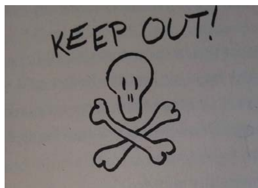
Рис. 3. Креолізований елемент у романі Д. Айвза "Voss"

Зображення є оголошенням у газеті, що втрапила до рук автора листа. Про це свідчить його текстове оточення: "Below the article about Noah McBloomingdale was an enormous advertismint [8, p. 59]". Оформлення оголошення захопило передусім увагу автора листа, яке він, для детального ілюстрування ситуації уводив у текст свого повідомлення. Ряд риторичних питань, який спершу змусив відчувати самого адресанта передбачуваним реципієнтом інформації, що повідомляється, має на меті привнести частку співчуття, оформивши helping hand у тексті оголошення великими літерами і змушує адресанта зрозуміти, що інформація саме для нього (точніше, для його дядечка, що стає відомим у процесі дискурсного розгортання). Друга частина оголошення пропонує вихід із ситуації, приєднавшись до Pilgrim's Paradise . Назва установи також виділена особливостями оформлення шрифту. Далі за допомогою називних речень із застосуванням анафори представлені пропоновані переваги цього закладу. У наступному випадку креолізованого тексту передую наступна інформація: "The basement lay three long flights down. The farther down I went, the colder the air. I sheevered by the time I reached bottom. The stairs ended at another door with a pooshbar. A red-painted sign hung on the door at my eyes level [8, p. 105]".