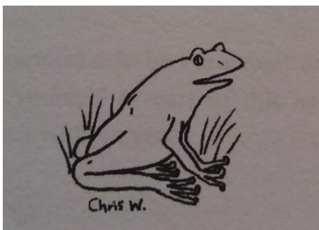
Рис. 4. Іконічний компонент у романі Т. Вартона “Every Blade of Grass”

В епістолярному романі “Every Blade of Grass” Томаса Вартона, що написаний у формі традиційних листів знаходимо приклад креолізованого тексту, що належить руці автора листа. Інші ілюстрації, включені у структуру епістолярного роману, слугують для відділення глав та не апелюють до текстової інформації (рис. 4).