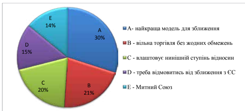
Рис. 1. Оцінка рівня поінформованості населення України про ЄС

Дослідження показує, що для 30% мешканців України повне членство у ЄС бачиться найкращою моделлю для зближення. Головними перешкодами називають брак коштів і хабарництво. Наступна відповідь за популярністю щодо моделі зближення з ЄС – вільна торгівля без жодних обмежень (21%). І третя відповідь – влаштує нинішній ступінь відносин (20%), а 14% вважають, що треба відмовитись від зближення з ЄС (рис. 2).