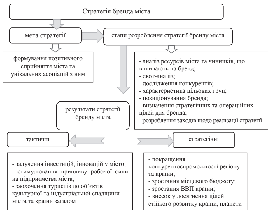
Рис. 3. Мета, етапи та результати стратегії бренду українського міста

До щорічного рейтингу індексу якості життя від дослідницького сервісу Numbeo у 2018 році потрапило п'ять українських міст, серед міст України перше місце посів Львів,