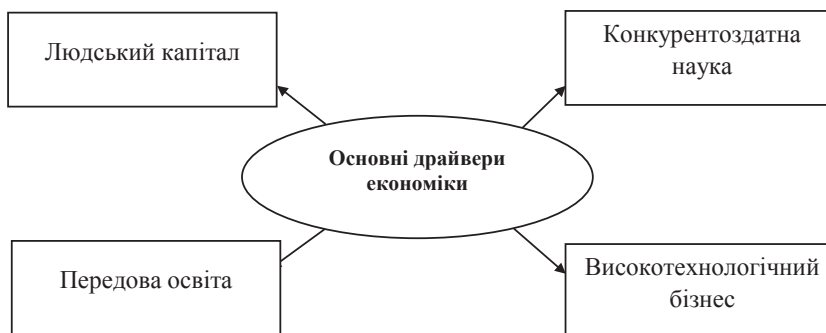
Рис. 2. Основні драйвери розвитку економіки [11]

Таким чином, важливим завданням запропонованого організаційно-економічного механізму є забезпечення комплексного використання інноваційного потенціалу, а вихідним чинником ефективності його використання є синергетичний підхід, що полягає у взаємодії різних структурних підрозділів на підприємстві між собою.