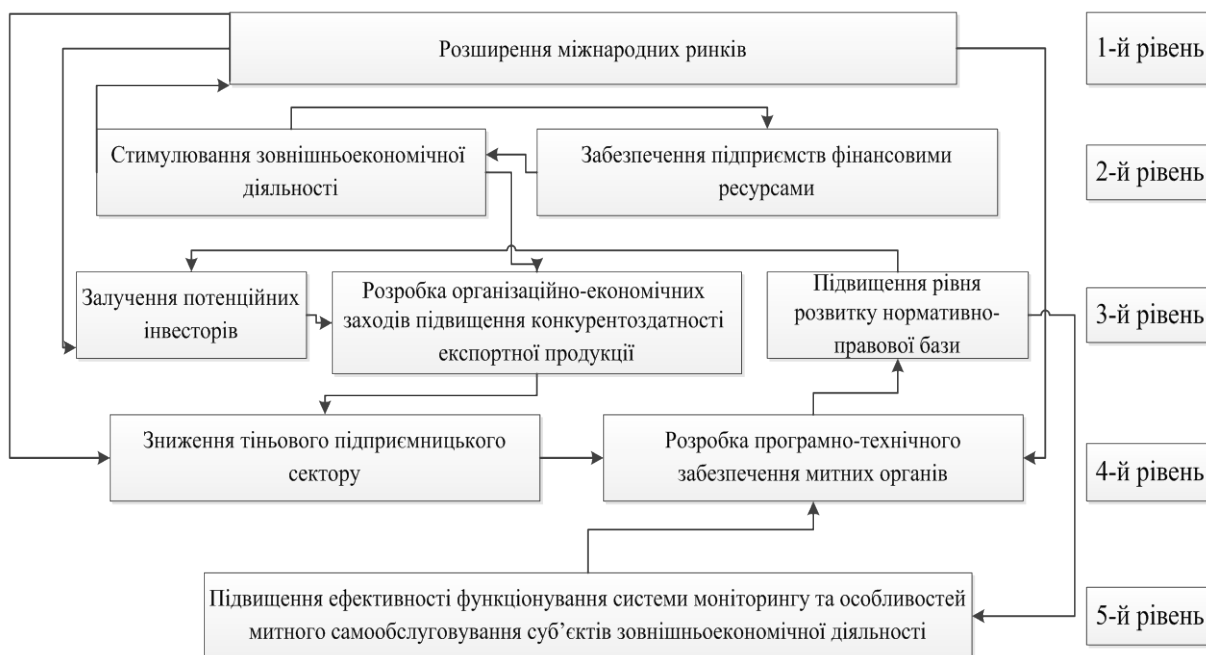
Рис. 3. Ієрархія зв'язку напрямів розвитку ефективної системи управління посередниками та суб'єктом зовнішньоекономічної діяльності

забезпечення підприємств фінансовими ресурсами. Загальний вигляд структури ієрархії зв'язку напрямів розвитку ефективної системи управління посередниками та суб'єктом зовнішньоекономічної діяльності подано на рис. 3.