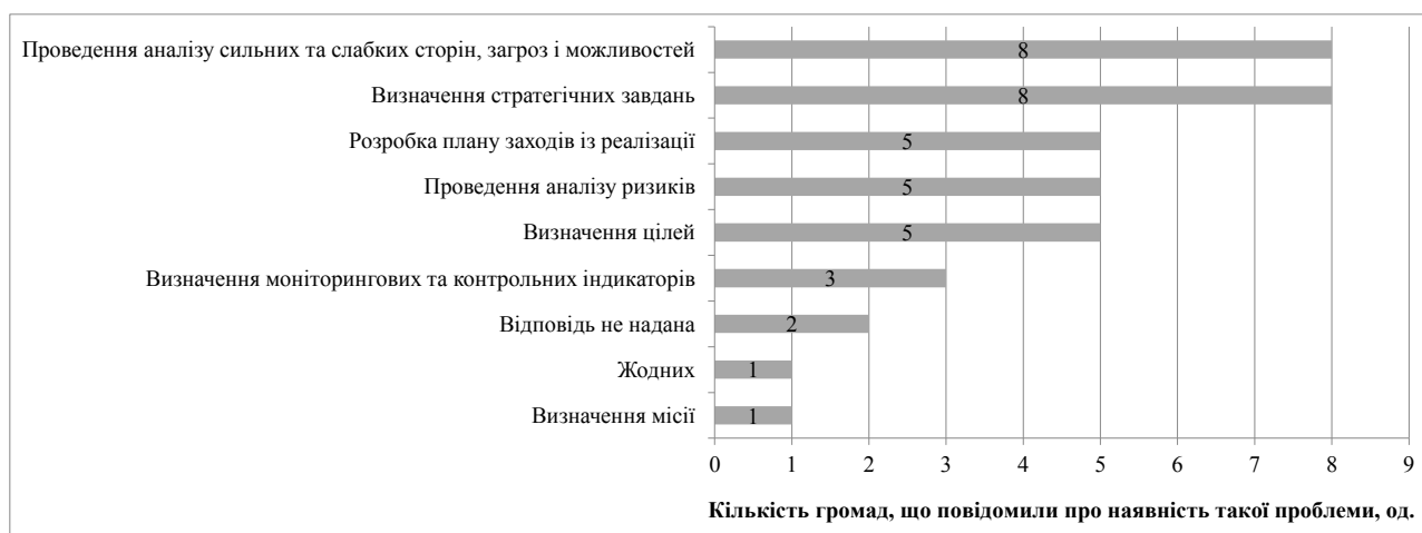
Рис. 1. Питання, які були найбільш проблемними для робочої групи під час розроблення стратегії розвитку території

Зважаючи на те, що чітких методичних настанов щодо формування системи моніторингових індикаторів у нормативно-правових актах не надано (наприклад, рекомендованих контрольних показників, їхнього змісту та спрямованості тощо) [9; 10], ми можемо припустити, що відсутність проблемного характеру даного аспекту підготовки стратегії свідчить, скоріше, про певне нехтування ним.