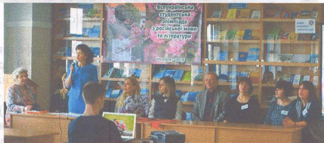
Всеукраїнська олімпіада з російської мови та літератури