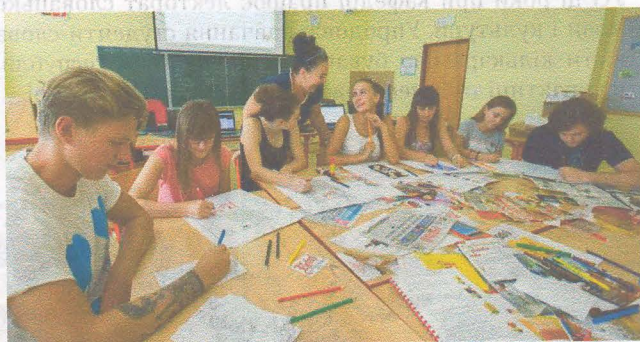
Богемісти в Гавличковому Броді

гічному факультеті. Так, завдяки налагодженій співпраці студенти чеського відділення мають змогу практикуватися у Літній школі журналістики імені Карла Гавлічка Боровського в Гавличковому Броді (Чеська Республіка), їздити туди на книжковий форум видавців, отримали необхідну для навчання наукову літературу, а цьогоріч – ще й дві реконструйовані аудиторії.