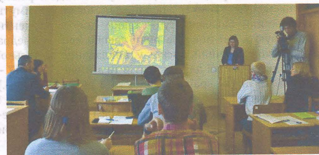
Наукове життя кафедри журналістики