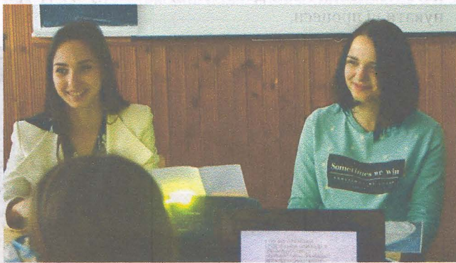
Майбутні фахівці зі спеціальності «Реклама і зв'язки з громадськістю»