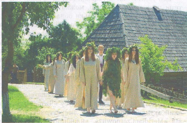
Фрагмент календарно-обрядового дійства

ки у супроводі календарно-обрядових танців у сучасній інтерпретації), інші цікаві перформенси.