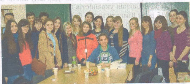
Зустріч з письменником Андрієм Любкою