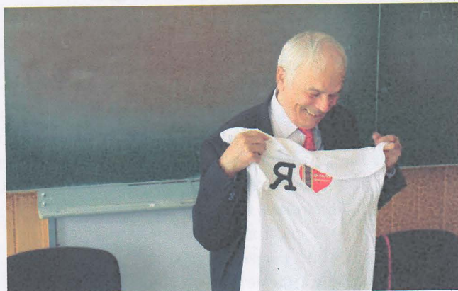
Акад. Василь Німчук був великим приятелем філфаку

2018 року на відділенні україністики запроваджуються три нові освітні програми: «Українська мова і література в закладах загальної середньої освіти з мовами навчання національних меншин», «Українська мова і література. Англійська мова і література» в рамках спеціальності «Середня освіта» та «Українська мова і література. Літературна творчість. Документознавст-