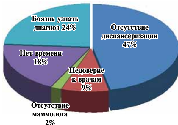
Рис. 4. Распределение причин игнорирования регулярного обследования МЖ

Существуют общепризнанные преграды для женщин из развивающихся стран в прохождении не только скрининга РМЖ, но и своевременного обращения за помощью к специалисту [7, 8, 15].