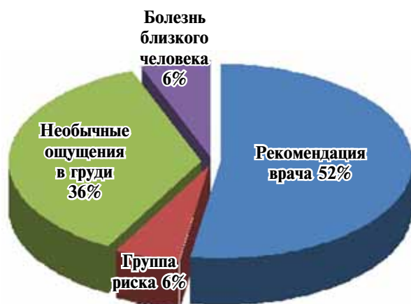
Рис. 3. Распределение аргументов в пользу прохождения специального обследования молочных желез

КОМЖ, 30% женщин проходили обследование у гинеколога более 2 лет назад, а 90% опрошенных даже не могут вспомнить, когда они последний раз были у специалиста - маммолога.