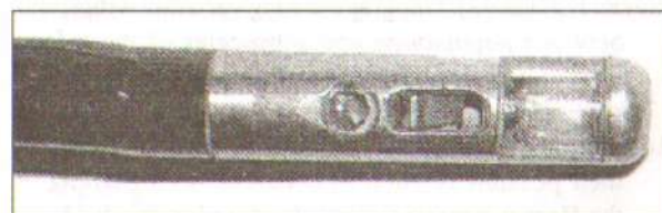
Фото 2. Об'єктив і джерело світла. Photo 2. Lens and source of light.