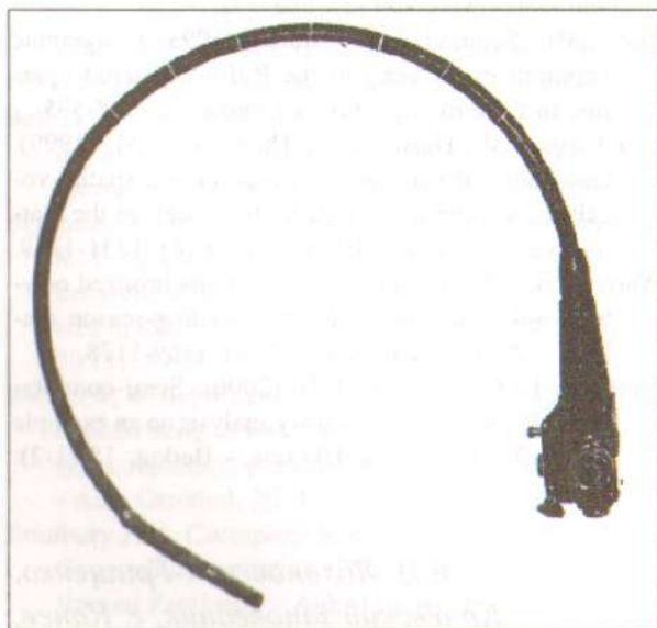
Фото 1. Загальний вигляд ендоскопа. Photo 1. General view of endoscope.

Гніздова камера закритого типу, як правило, мало освітлена, і тому виникає потреба в додатковому джерелі світла. Для цього можна використати лампочку самого ендоскопа (фото 2), або встановити додаткове