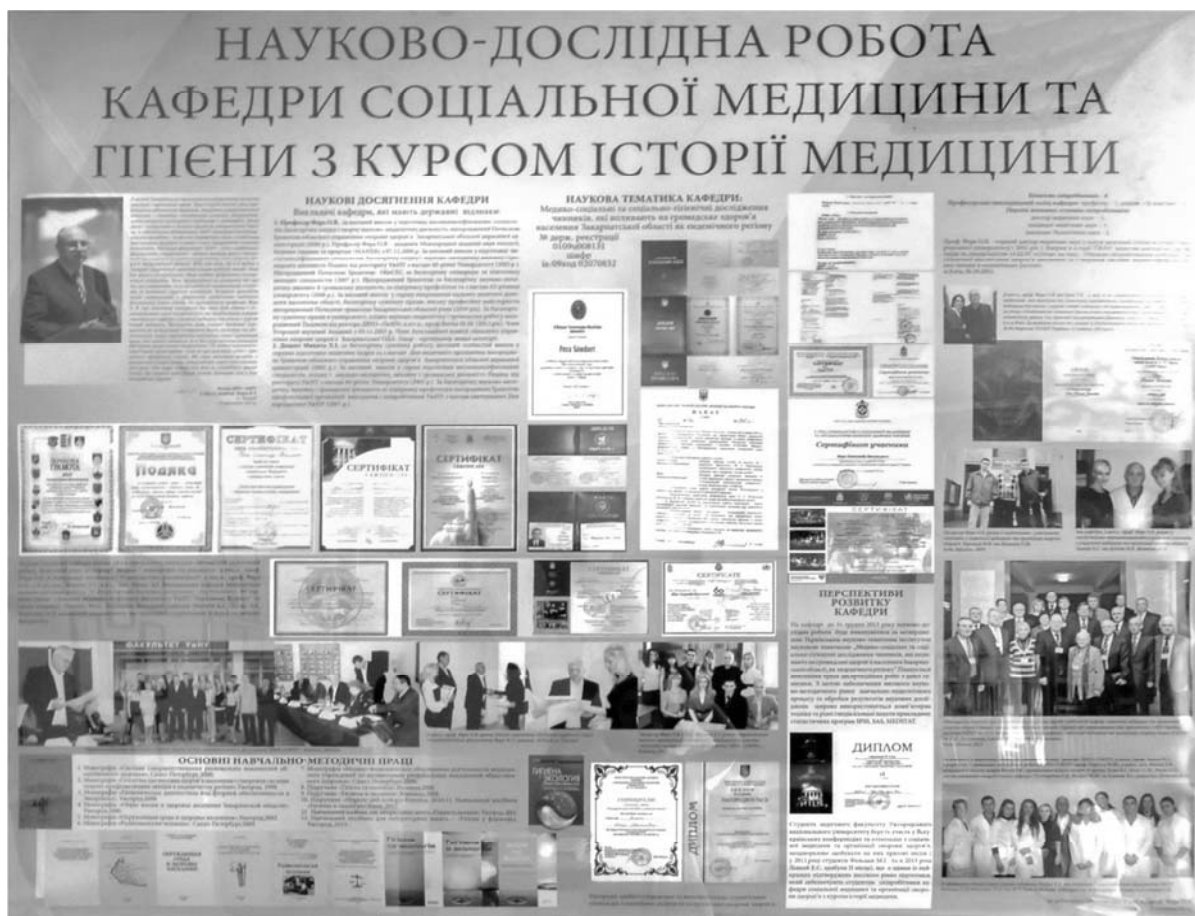
Рис. 2. Науково-дослідна робота кафедри соціальної медицини та гігієни з курсом історії медицини.

На іншому стенді висвітлено сьогоднішня кафедра та наукові досягнення її працівників (рис. 2).