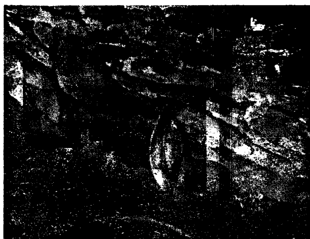
№2. Доїння молока з рогу вкрученого в стіну хліва. Реконструкція.