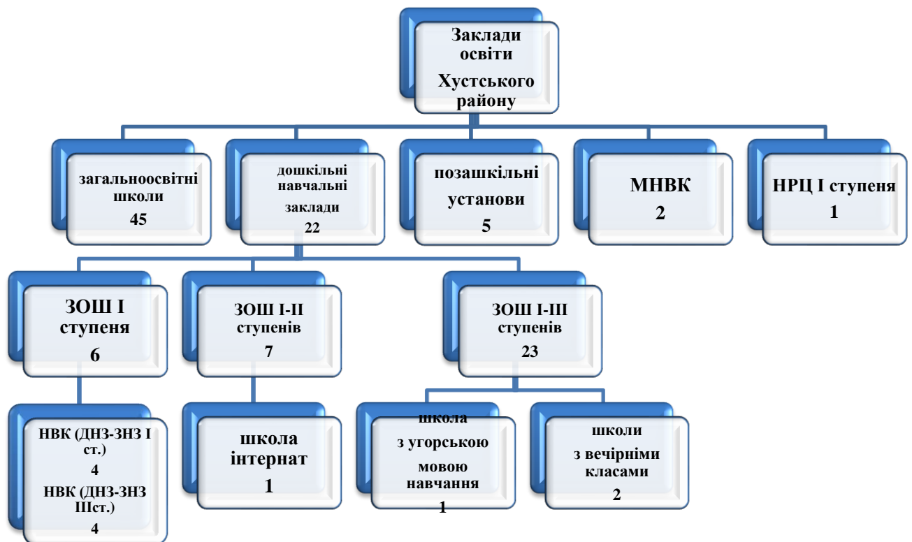
Рис.2. Мережа закладів освіти Хустського району

З метою надання освітніх послуг представникам національних меншин у регіоні Вишківської селищної ради функціонує Вишківський навчально - виховний комплекс „загальноосвітній навчальний заклад I – III ст. – дошкільний навчальний заклад” ім.Ференца Келчеї із угорською мовою навчання, у якому навчається 391 учень та Вишківська ЗОШ I ст. для дітей ромської національності, у якій навчаються 41 учнів. (Рис.2)