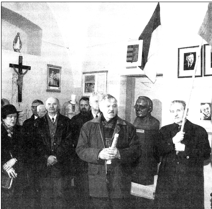
Під час відкриття меморіального музею А. Волошина в Ужгороді 14 березня 2002 р.