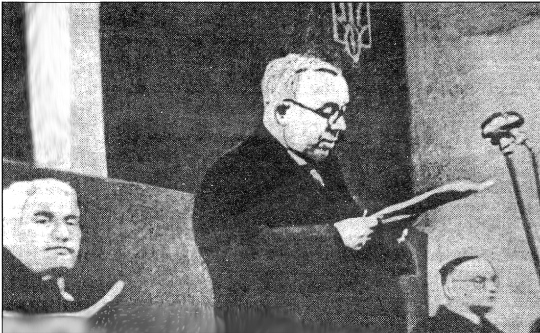
Виступ А. Волошина на відкритті Союму Карпатської України 15 березня 1939 р.