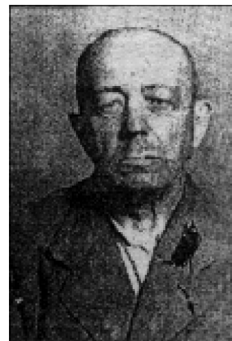
А. Волошин — в'язень Лефортовської тюрми в Москві