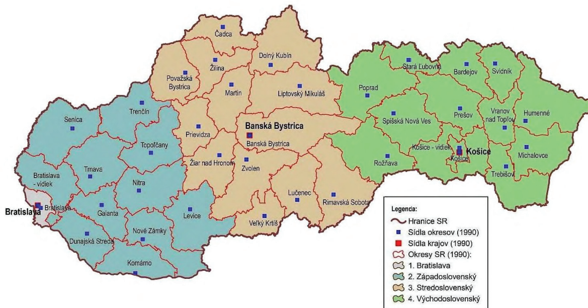
Додаток А. Адміністративно-територіальний поділ Словаччини 1971–1990 рр.

© 2004, ErasData-Pro, spol. s r. o., Ing. Miloslav Kís, odbor informatiky SVS MV SR