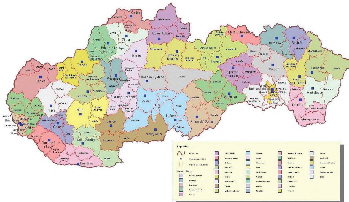
Додаток Б. Адміністративно-територіальний устрій 1990–1996 рр. Округи та обводи

© 2004, ErasData-Pro, spol. s r. o., Ing. Miloslav Kís, odbor informatiky SVS MV SR